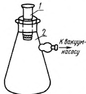
1 — тигель или воронка стеклянные фильтрующие; 2 — колба для фильтрования под вакуумом