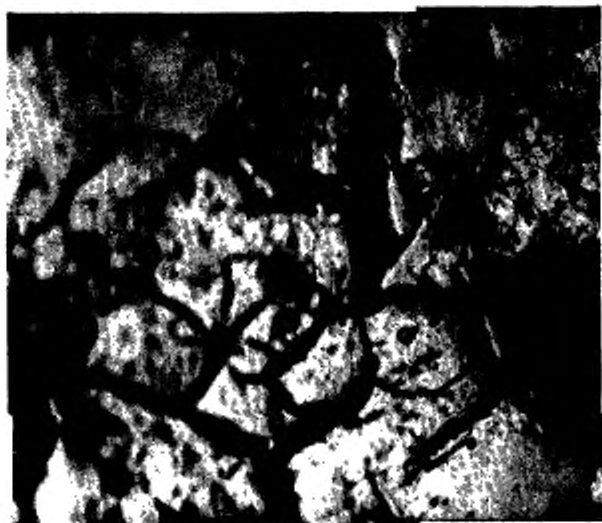
Высокая степень выветрелости угля. Увеличение количества трещин и снижение рельефа в местах их развития