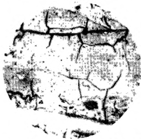
Увеличение клиновидных и образование ветвистых трещин и появление каверн