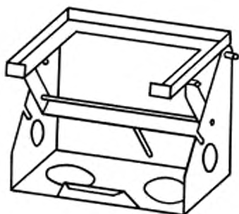
Рисунок 1 — Пример поворотной рамки, установленной в горизонтальном положении

3.9 Поворотная рамка (рисунки 1 и 2), позволяющая в лабораторной печи размещать пластину для растекания в горизонтальном и наклонном под углом 45° положении.