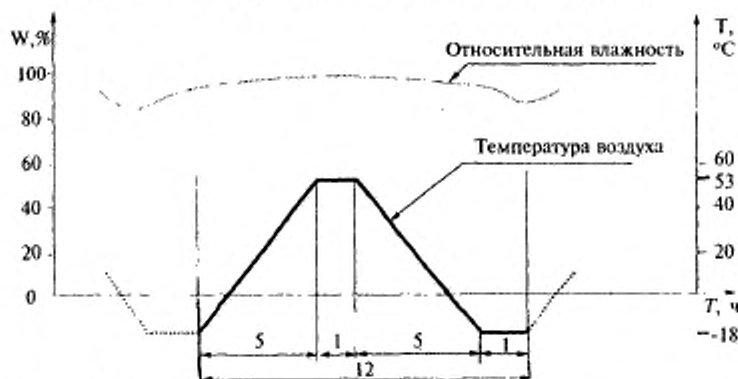
Рисунок А.2 — График одного цикла испытаний (первая часть испытаний по режиму IV)