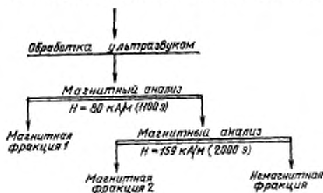
ТАБЛИЦА РЕЗУЛЬТАТОВ МАГНИТНОГО АНАЛИЗА