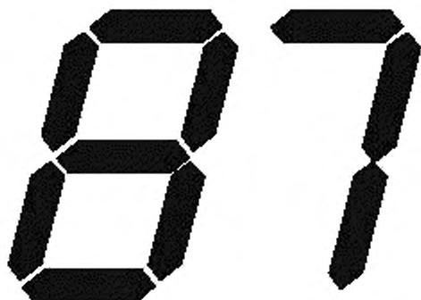
Рисунок 1 — Сегментированный дисплей