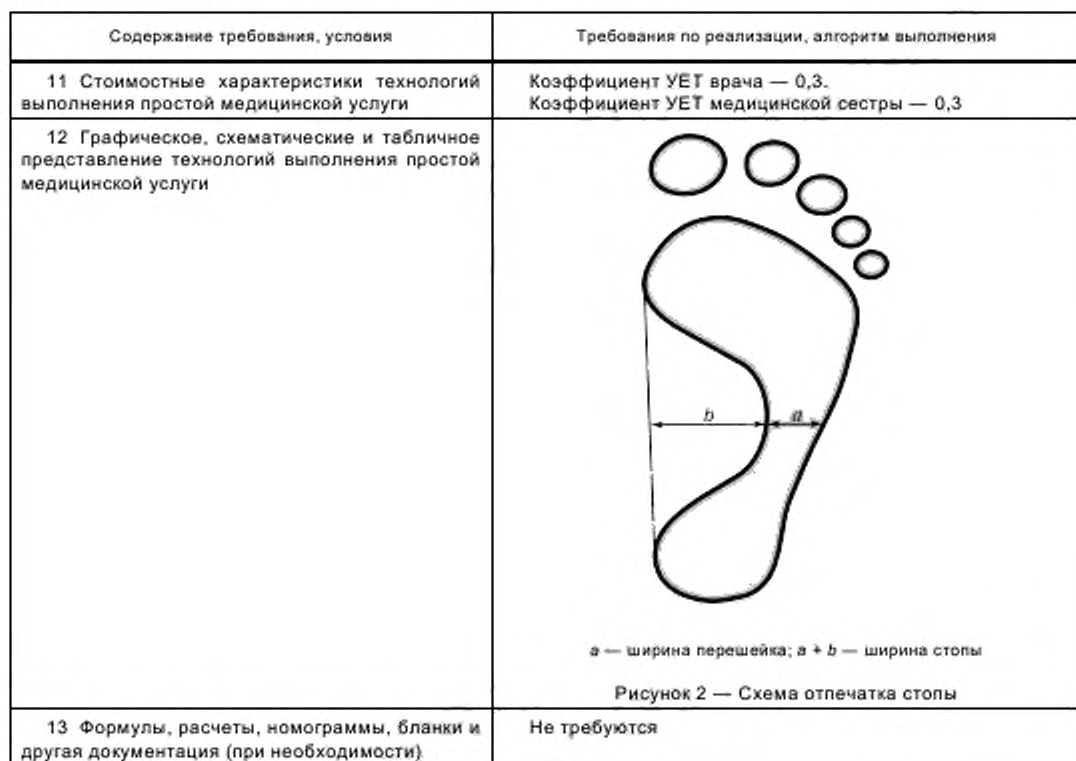
Окончание таблицы 4