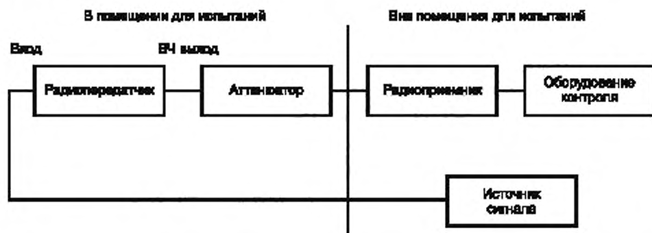
Рисунок 3 — Схема соединений испытуемого радиопередатчика и вспомогательного оборудования при проведении испытаний на помехоустойчивость

Во время испытаний на помехоустойчивость испытуемый радиопередатчик должен работать при номинальной выходной мощности. При подаче сигнала на вход радиопередатчика (см. рисунок 3) учитывают требования 4.2.1. Линия связи должна быть установлена в начале испытания и поддерживаться в течение испытания.