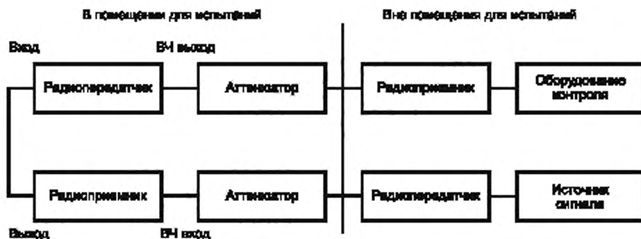
Рисунок 5 — Схема соединений испытуемого приемопередатчика и вспомогательного оборудования при проведении испытаний на помехоустойчивость

Во время испытаний на помехоустойчивость полезный входной радиочастотный сигнал подают на радиоприемник (см. рисунок 4) с учетом требований 4.2.3. Линия связи должна быть установлена в начале испытания и поддерживаться в течение испытания.