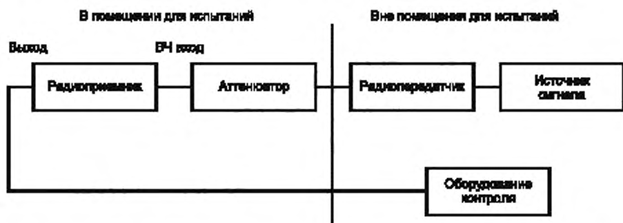
Рисунок 4 — Схема соединений испытуемого радиоприемника и вспомогательного оборудования при проведении испытаний на помехоустойчивость

Во время испытаний на помехоустойчивость испытуемый радиопередатчик должен работать при номинальной выходной мощности. При подаче сигнала на вход радиопередатчика (см. рисунок 3) учитывают требования 4.2.1. Линия связи должна быть установлена в начале испытания и поддерживаться в течение испытания.