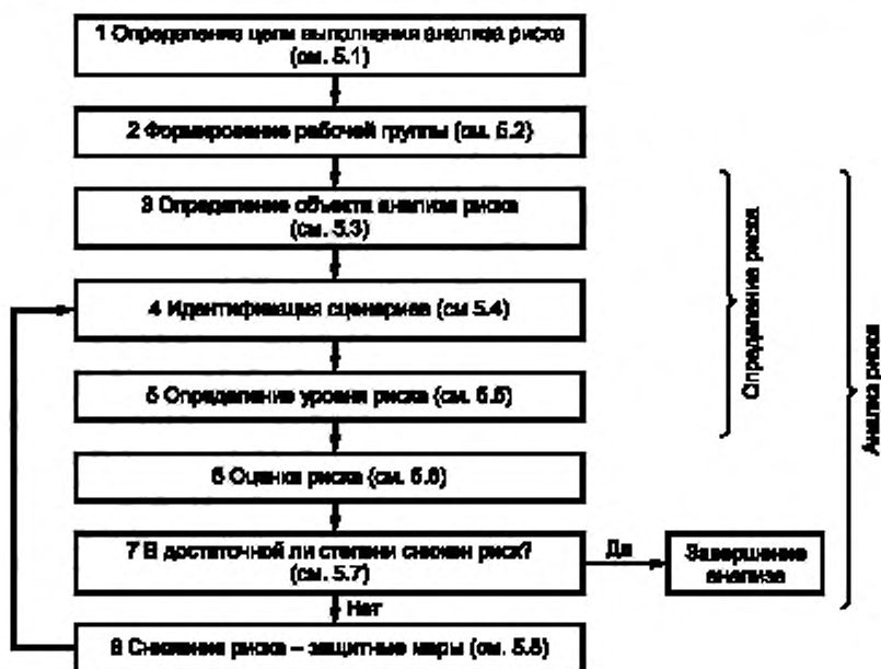
Рисунок 1 — Схема выполнения анализа и снижения риска