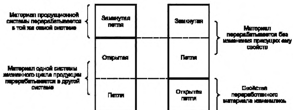
Рисунок 2 — Отличие между техническим описанием производственной системы и процедурами распределения для рециклинга

4.3.4.3.4 При использовании процедуры распределения для общих единичных процессов, указанных в 4.3.4.3, в качестве основы для распределения, если это осуществимо, следует использовать следующие показатели: