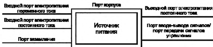
Рисунок 1 — Примеры портов источника питания

Примечание — Примеры портов см. на рисунке 1.