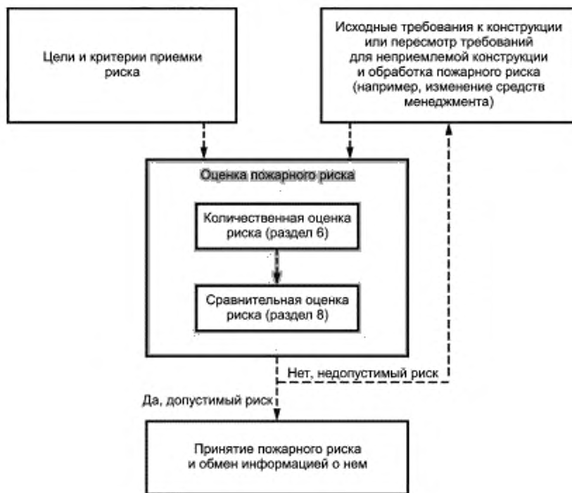
Рисунок 1 — Схема менеджмента пожарного риска

Менеджмент риска включает оценку риска, обработку риска, принятие риска и обмен информацией о риске. После обработки риска может потребоваться повторная оценка риска (см. рисунок 1). Оценка пожарного риска может также быть использована для оценки сценариев пожара альтернативных конструкций объекта защиты до выбора конкретной конструкции или внесения изменений в существующую конструкцию объекта защиты и направлена на достижение выполнения критериев допустимости и соответствия установленным требованиям.