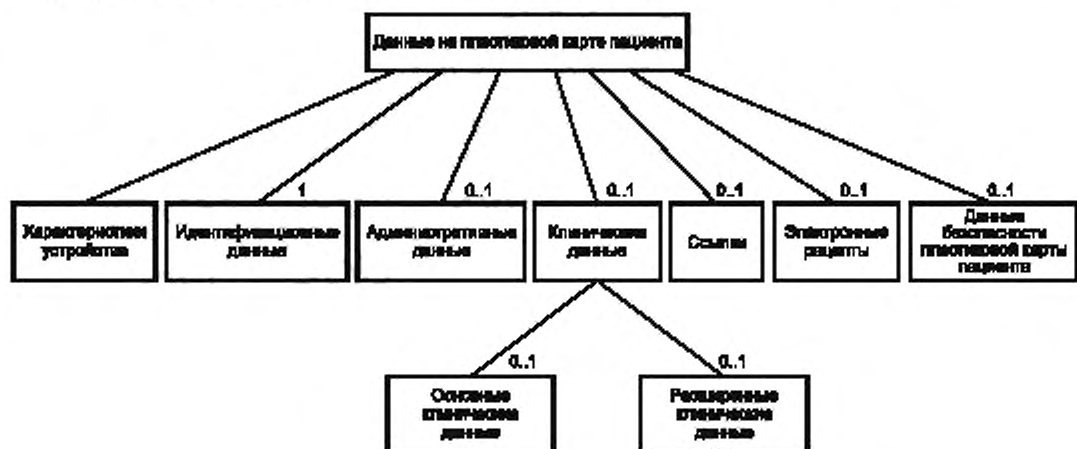
Рисунок 1 — Общая структура данных на пластиковой карте пациента

Общая структура данных медицинской карты пациента, основанная на объектно-ориентированной модели, представлена в виде диаграммы классов UML на рисунке 1.