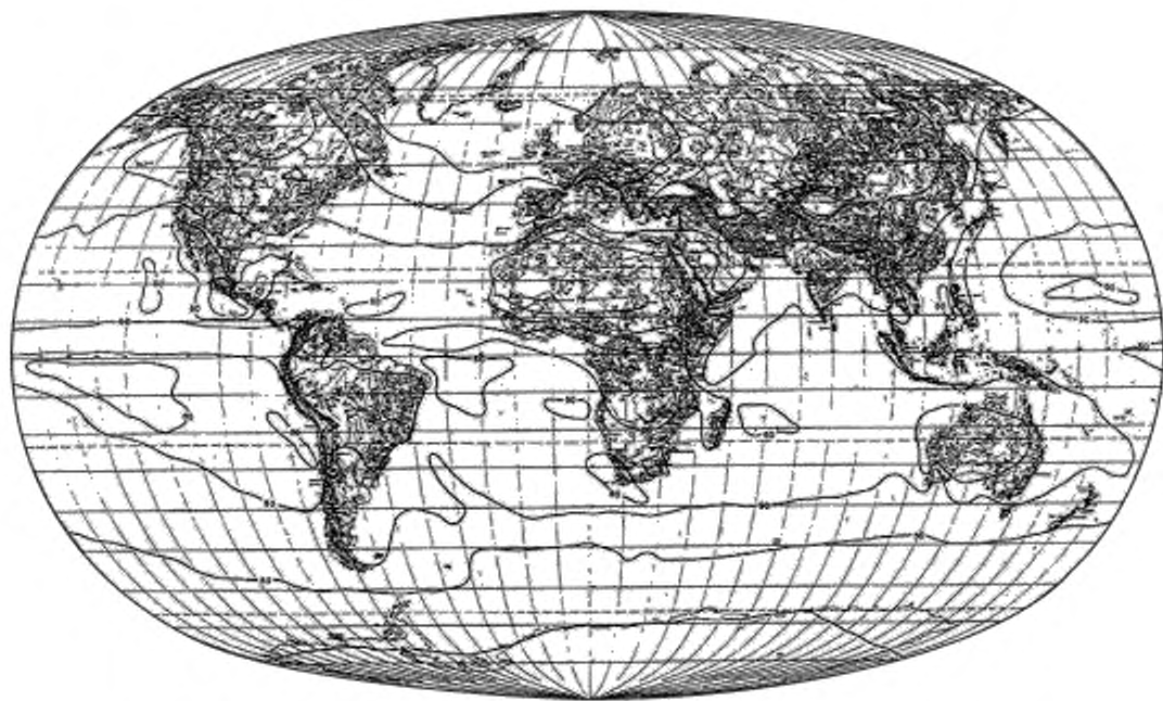
Рисунок А.2 — Средняя энергетическая суточная экспозиция за декабрь (в процентах)