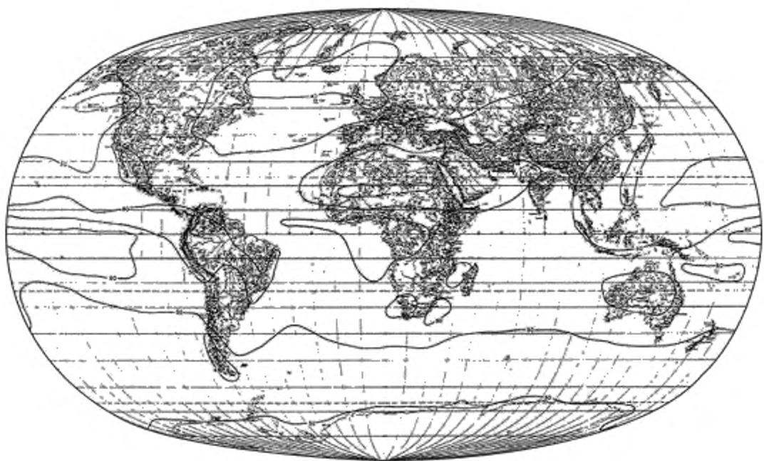
Рисунок А.3 — Средняя энергетическая суточная экспозиция за год (в процентах)