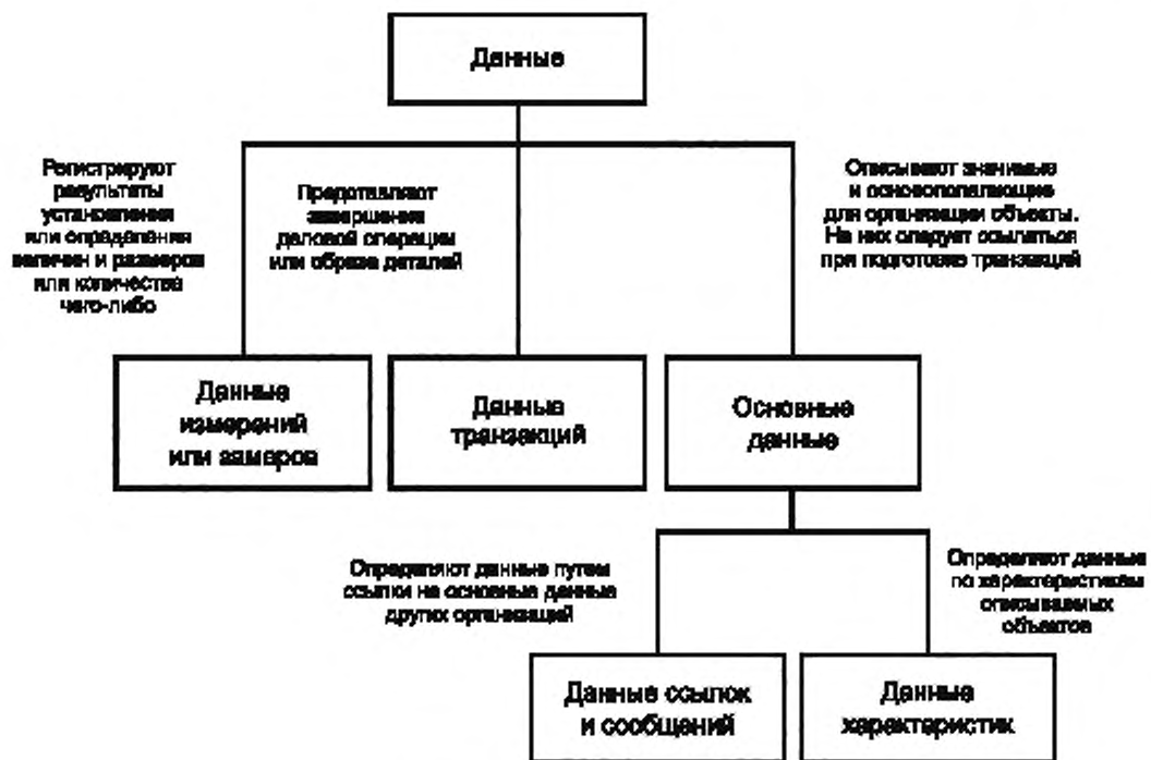
Рисунок 1 — Таксономия данных

Пример 3 — Идентификатор налога с доходов корпорации, номер индивидуального страхового полиса, номер детали, назначенный производителем произведенному изделию, — все это примеры идентифицирующих ссылки.