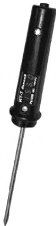
Рисунок Б.1 — Цифровой переносной термометр-щуп ИТ-7

Б.1 Цифровой переносной термометр-щуп приведен на рисунке Б.1.