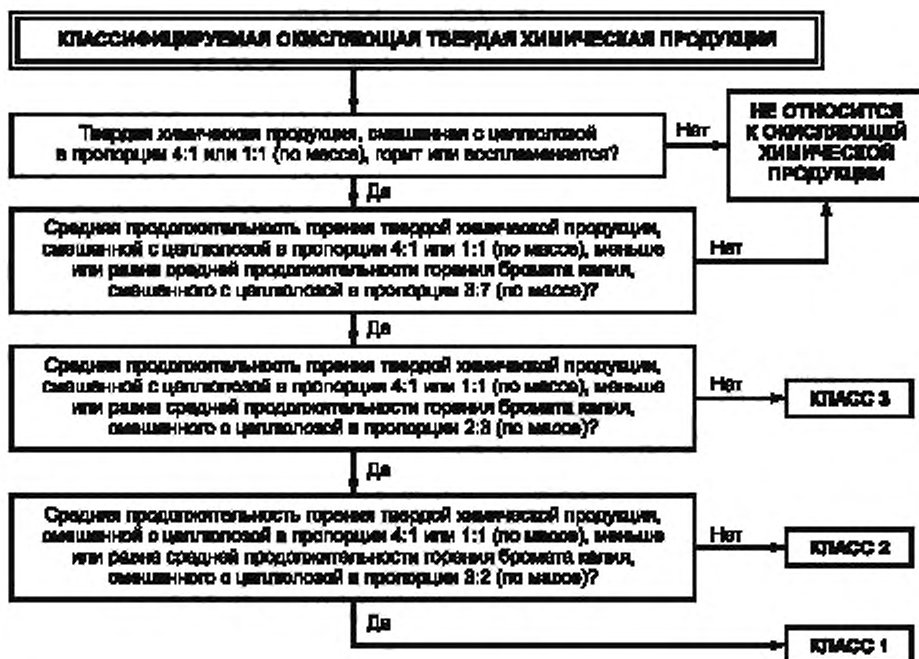
Рисунок 1 — Процедура классификации окисляющей твердой химической продукции

Процедура классификации опасности окисляющей твердой химической продукции представлена на рисунке 1.