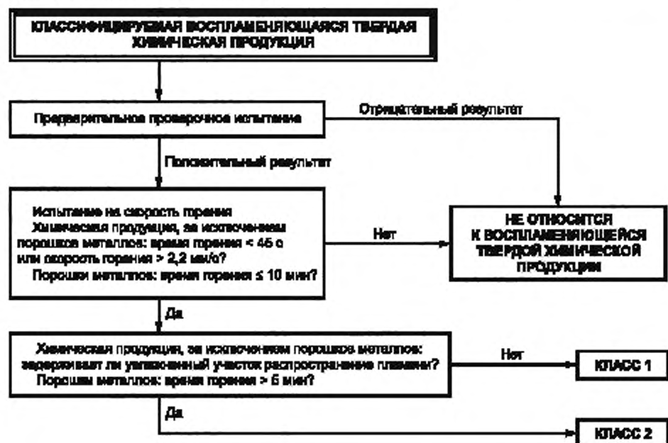
Рисунок 1 — Процедура классификации воспламеняющейся химической продукции, находящейся в твердом состоянии

4.1.2 Процедура классификации воспламеняющейся химической продукции, находящейся в твердом состоянии, представлена на рисунке 1.