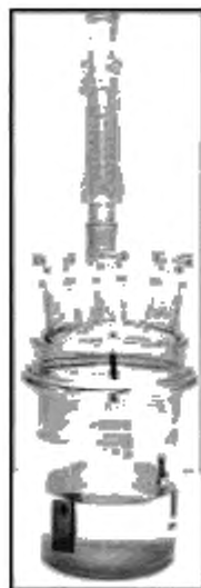
Рисунок 3 — Реакционный сосуд с парциальным конденсатором

4.2.3.7 После окончания испытания металлические образцы промывают и очищают щеткой с синтетической или натуральной щетиной (неметаллической). Остатки, которые невозможно удалить механическим путем (появившиеся продукты коррозии или отложения), удаляют с помощью ингибированных растворов для травления.