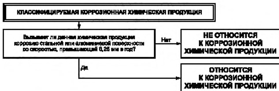
Рисунок 1 — Процедура классификации опасности коррозионной химической продукции

Процедура классификации опасности коррозионной химической продукции представлена на рисунке 1.