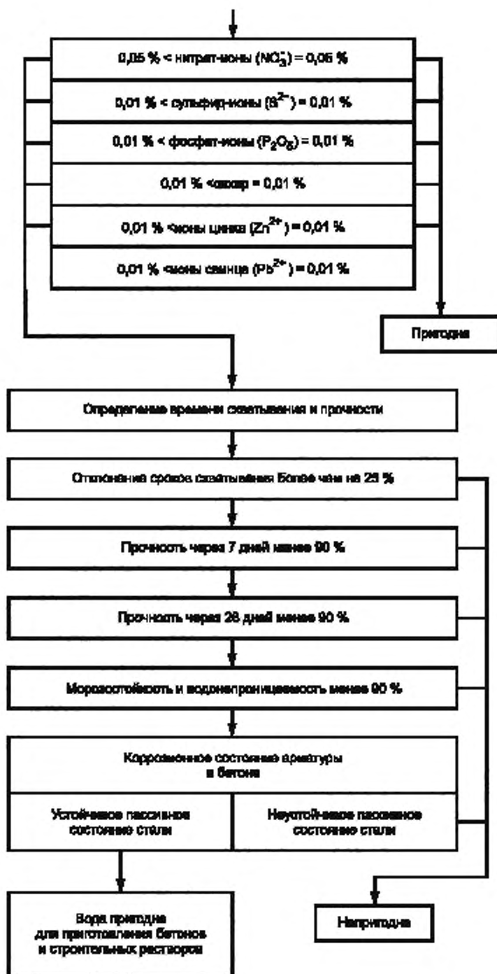
Рисунок А.1 (лист 2)