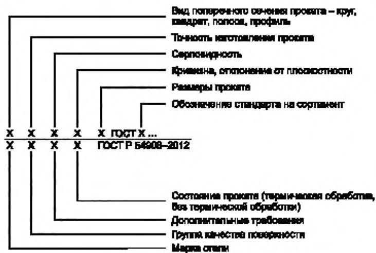
ДГ.4 Схема условных обозначений длинномерной и листовой металлопродукции из жаростойкой стали