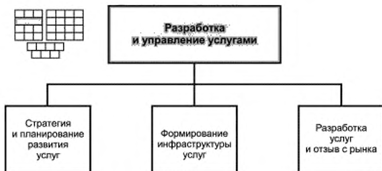
Рисунок 3 — Декомпозиция группы процессов SD&M на элементы процессов уровня 2

6.1 Структура горизонтальной группы процессов SD&M — «Разработка и управление услугами» и соответствующие элементы процессов уровня 2 приведены на рисунке 3.