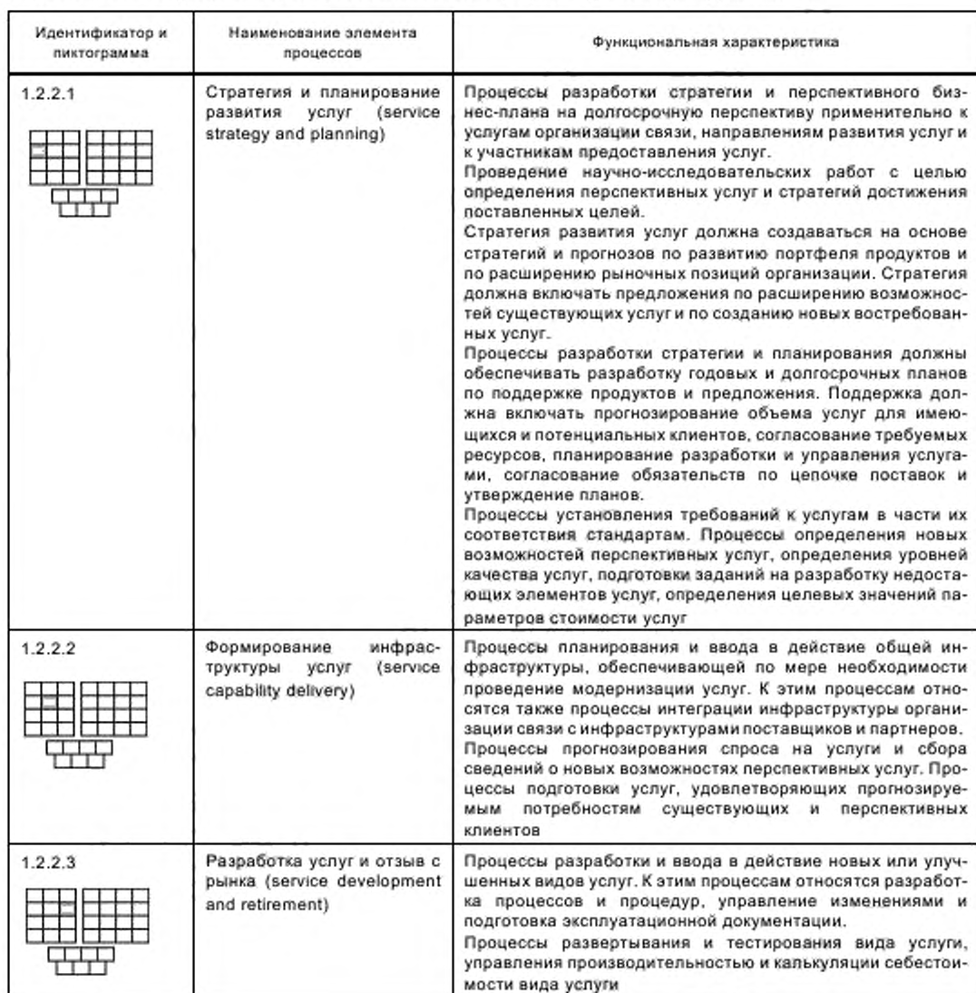
Т а б л и ц а 1 — Функциональные описания элементов процессов уровня 2 для группы SD&amp;M