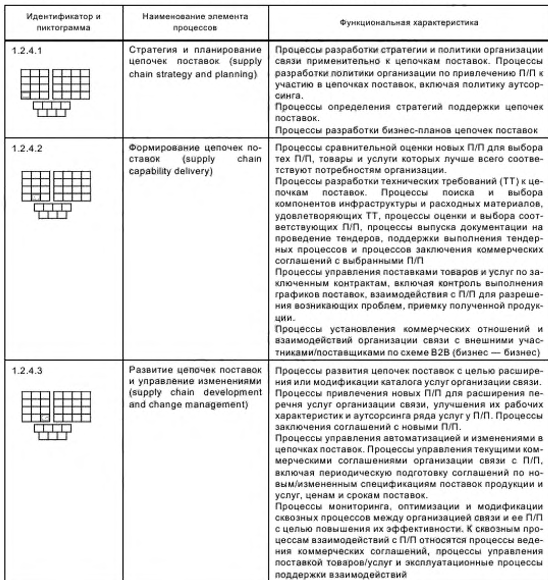
Т а б л и ц а 1 — Функциональные описания элементов процессов уровня 2 для группы SCD&amp;M