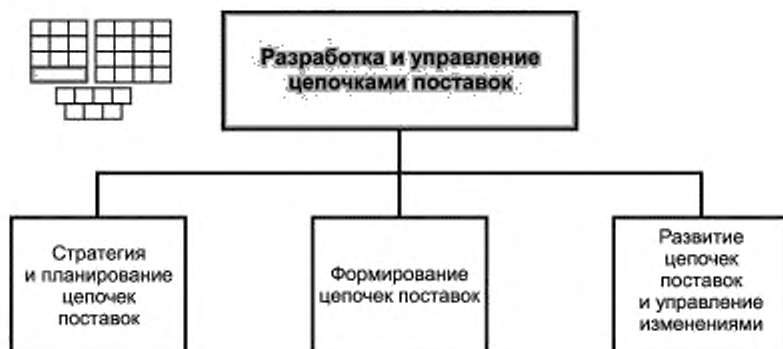
Рисунок 3 — Декомпозиция группы процессов SCD&M на элементы процессов уровня 2

6.1 Структура горизонтальной группы процессов SCD&M — «Разработка и управление цепочками поставок» и соответствующие элементы процессов уровня 2 приведены на рисунке 3.