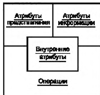
Рисунок 1 — Общая схема определения доступности графических значков

Рисунок 1 представляет собой общую схему для определения доступности значков. На нем показано, что существуют четыре основных взаимосвязанных фактора, которые необходимо учитывать при создании доступных значков: атрибуты, которые обеспечивают внутреннюю идентификацию значка; атрибуты, которые описывают значок в текстовой форме; атрибуты графического представления значка и операции, связанные со значком. Внутренние атрибуты определяют заданную функцию значка для того программного обеспечения, которое использует данный значок, и позволяют отличить его от других значков. Атрибуты описания предоставляют пользователю информацию о назначении и использовании значка и создают основу для его распознавания вне зависимости от среды функционирования. Атрибуты представления зависят от среды функционирования значка и являются источником информации для разработчиков и систем. Операции обеспечивают функциональные возможности значка, которые должны выполняться в рамках системы.