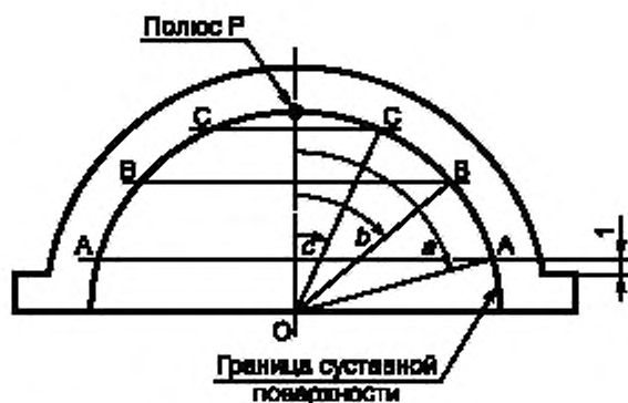
Рисунок А.2 — Расположение точек, измеряемых на вертлужной впадине