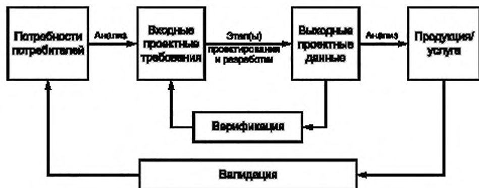
Рисунок 3 — Упрощенная схема взаимосвязи между верификацией и валидацией в процессе проектирования и разработки

Анализ может выполняться на разных стадиях процесса.