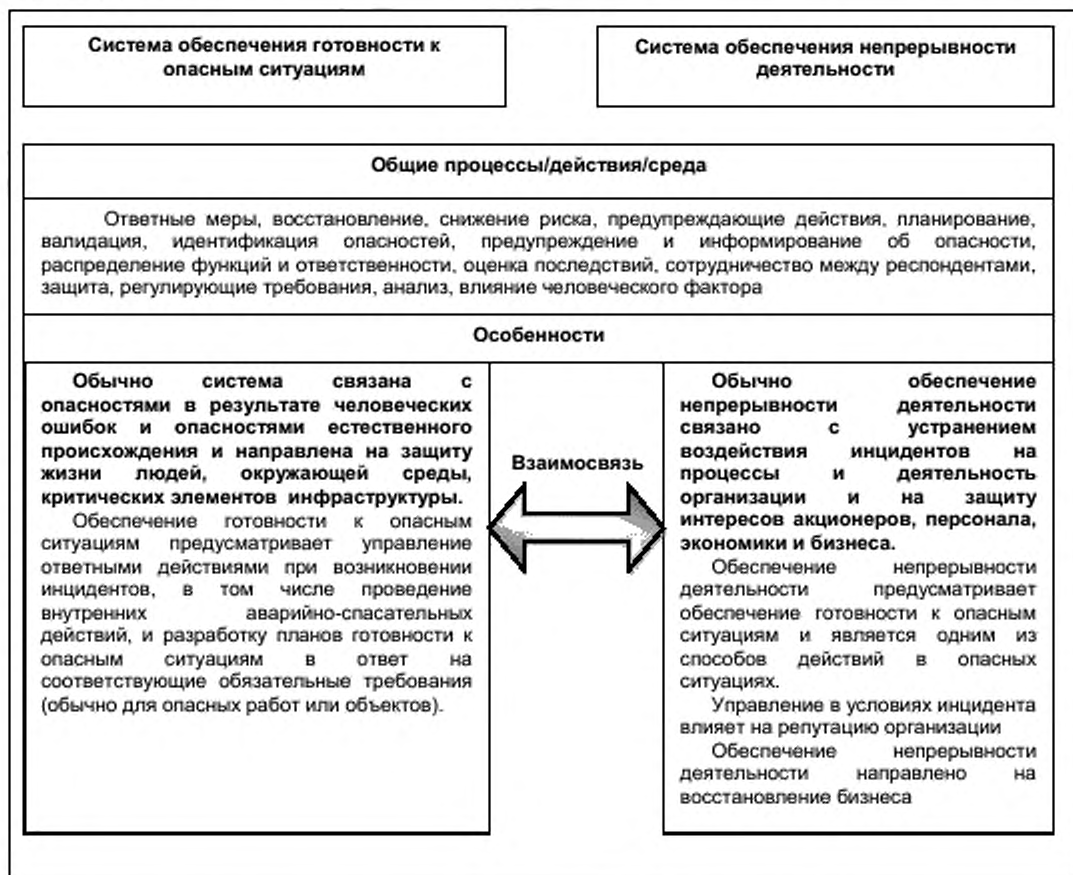
Рисунок 2 – Взаимосвязь элементов системы обеспечения готовности к опасным ситуациям и инцидентам и обеспечения непрерывности деятельности

Взаимосвязь элементов систем обеспечения готовности к опасным ситуациям и инцидентам, и обеспечения непрерывности деятельности приведена на рисунке 2. Данная схема предназначена только для информации.