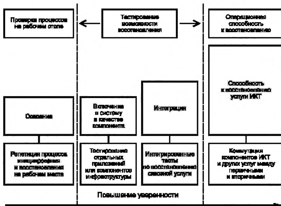
Рисунок 2 — Элементы восстановления услуг информационных и коммуникационных технологий

Необходимо тестирование следующих элементов: