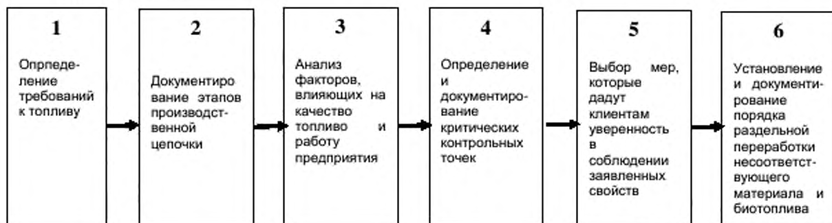
Рисунок 4 – Методология подтверждения качества

Выделяют шесть последовательных этапов. Этапы показаны на рисунке 4 и описаны ниже.