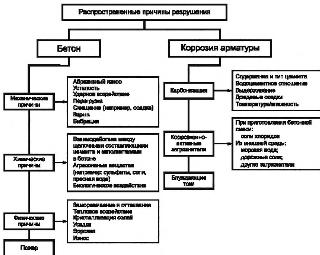
Рисунок 1 — Распространенные причины разрушений конструкций

Дальнейшей оценке подлежат примерный объем и вероятная интенсивность прироста дефектов. Следует определять, когда бетонная конструкция или ее элемент больше не будут функционировать так, как предполагалось, без принятия мер по защите или ремонту (не считая мер технического обслуживания находящихся в эксплуатации систем).