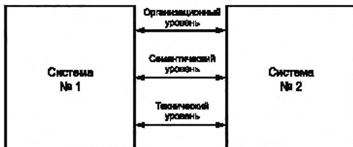
Рисунок 1 — Эталонная модель интероперабельности

Эталонная модель интероперабельности представляет собой развитие семиуровневой базовой эталонной модели ВОС согласно ГОСТ Р ИСО/МЭК 7498-1—99 (рисунок 1), [3], [4].