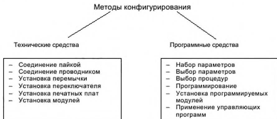
Рисунок 3 — Методы конфигурирования

Средства конфигурирования могут быть применимы на любом уровне системы. Методы поддержки этих средств показаны на рисунке 3