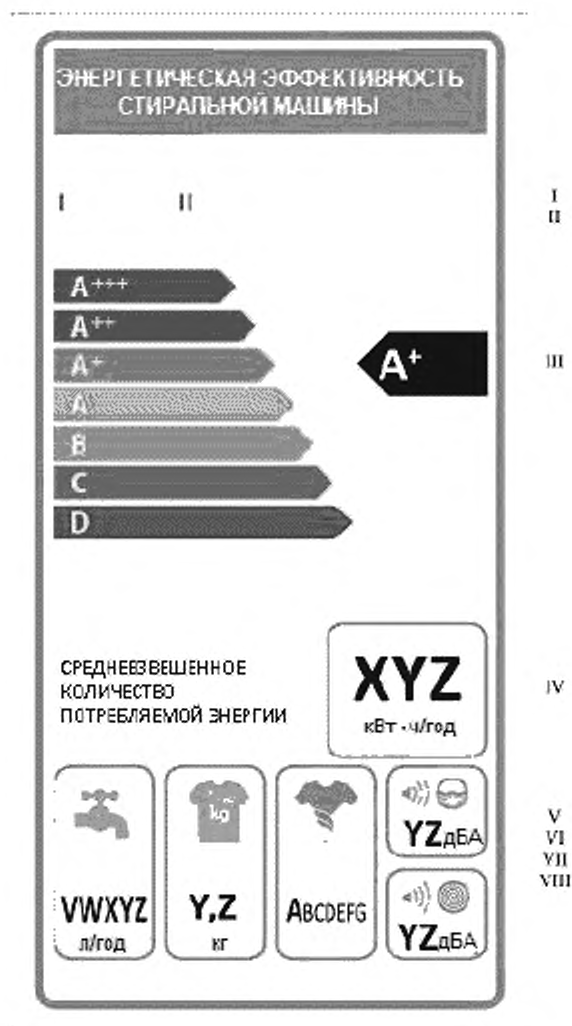
Рисунок А.1– Вид этикетки энергетической эффективности стиральных машин