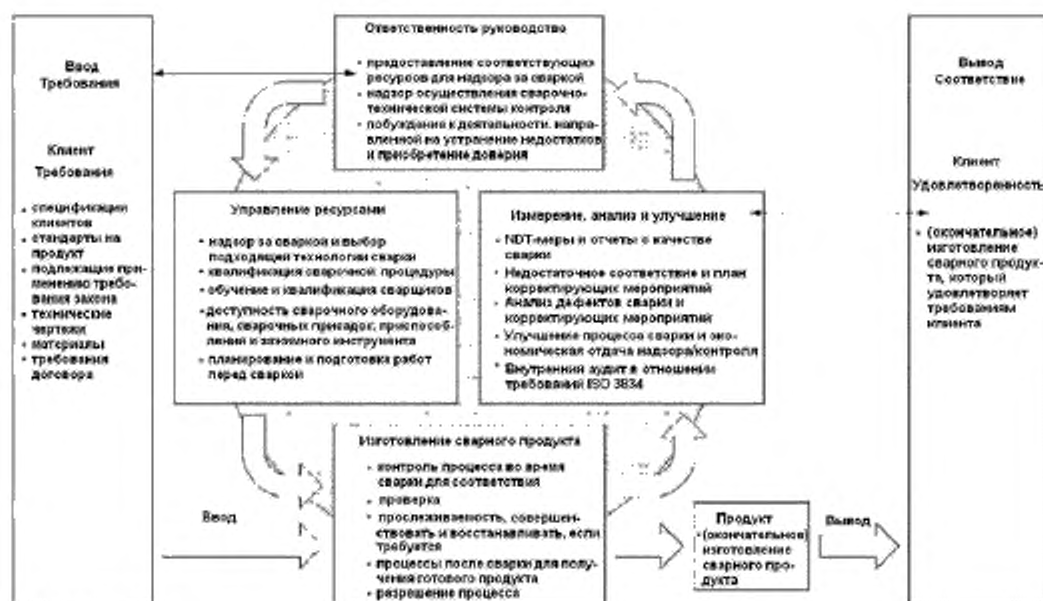
Рисунок 1 — Модель системы управления сварочным производством

степени зависит от участия в нем высшего руководства предприятия и его роли при проведении надзора и от осуществления действий при выявлении несоответствий. Проведение анализа со стороны руководства и внутреннего аудита обеспечивает участие руководства в системе управления сварочным производством, позволяет осуществлять надзор и принимать меры по устранению несоответствий. На рисунке 1 показана модель системы управления сварочным производством, содержащая перечень действий, направленных на обеспечение эффективности системы управления сварочным производством.