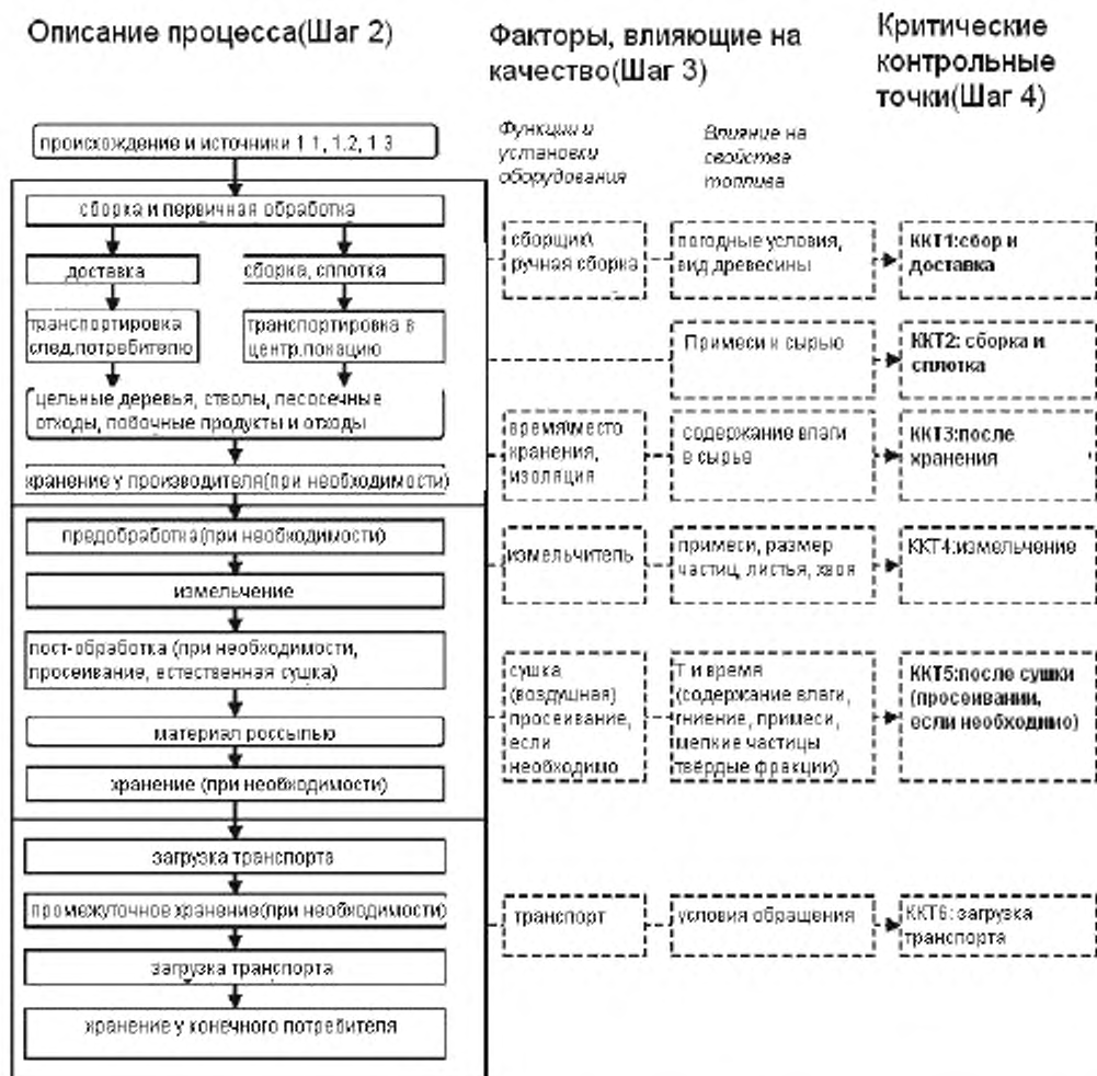
Схема 2 – Пример описания процесса производства с факторами, влияющими на качество, и критическими контрольными точками

Примеры описания процесса, включая соответствующие факторы, влияющие на качество, и критические контрольные точки (ККТ) приведены в схеме 2.