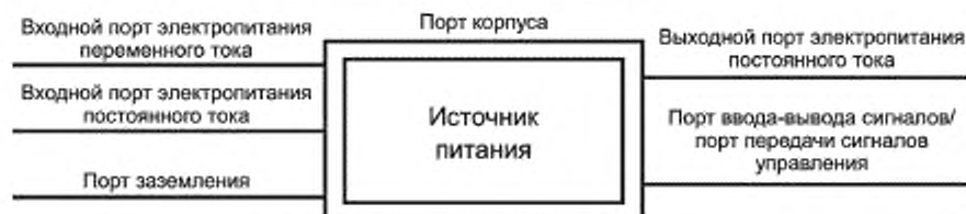
Рисунок 1 – Примеры портов источника питания

Пр и м е ч а н и е — Примеры портов см. на рисунке 1.