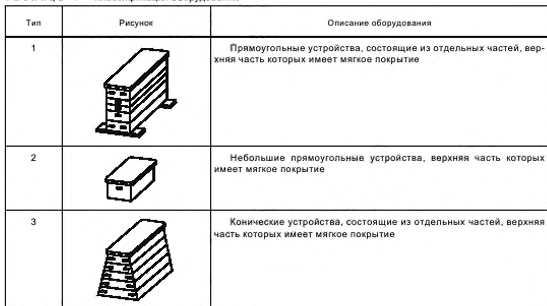
Т а б л и ц а 1 — Классификация оборудования

Классификация оборудования приведена в таблице 1.