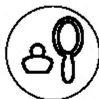
Рисунок А.2 — Укупорочные средства, предназначенные для парфюмерно-косметической продукции