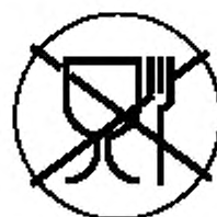
Рисунок А.3 — Укупорочные средства, не предназначенные для контакта с пищевой продукцией