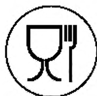
Рисунок А.1 — Укупорочные средства, предназначенные для контакта с пищевой продукцией