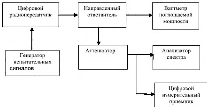
Рисунок 2 - Структурная схема для измерения параметров цифровых радиопередатчиков

Для радиопередатчиков по стандарту DVB-T на модуляторе устанавливают поочередно в соответствии с таблицей 1 максимальные скорости передачи данных при различных видах модуляции QPSK, 16-QAM, 64-QAM и значениях 2К, 8К. Для радиопередатчиков по стандарту DVB-T2 в соответствии с таблицами 2-7 устанавливают максимальные скорости при видах модуляции 16-QAM, 256-QAM и режимах 8К, 16К, 32К. От генератора испытательных сигналов на один из входов модулятора подают соответствующий транспортный поток данных, содержащий псевдослучайные последовательности или тестовые видеосюжеты. Для всех устанавливаемых режимов работы модулятора значения измеренной мощности должны соответствовать одному из значений 5.1 с допусками по 5.2.