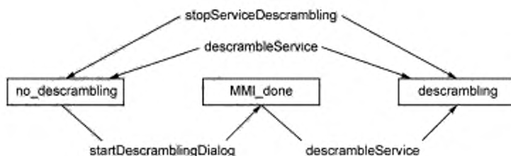
Рисунок 3 — Изменение состояния системы CA

По умолчанию система (класс CAModule) устанавливается в состояние «дескремблирование не введено». В этом состоянии дескремблирование не выполняется. Переход в состояние «дескремблирование введено» может быть выполнен двумя способами. Первый способ реализуется прямым вызовом метода startDescrambling. После вызова этой функции начинается процесс дескремблирования. В этом случае представление информации может включать диалоги пользователя по запросам системы CA. Если дескремблирование при использовании первого способа не возможно, то применяется второй способ, который заключается в вызове метода startDescramblingDialog. Это заставляет систему CA, в случае необходимости, начинать диалог с пользователем и ввести состояние «готовность интерфейса MMI» MMI_done. После этого состояния «дескремблирование введено» может быть достигнуто вызовом метода startDescrambling.