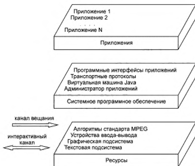
Рисунок 1 — Базовая архитектура MHP

5.3.2 Приложения платформы представляют собой функциональные реализации программного обеспечения, работающие в одном или в нескольких взаимодействующих аппаратных объектах.