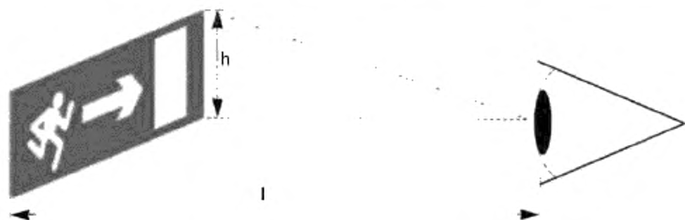
Рисунок 2 – Определение расстояния различения эвакуационного знака безопасности

Z – дистанционный фактор, который принимают равным 100 для знаков, освещаемых извне, и 200 – для освещаемых изнутри.