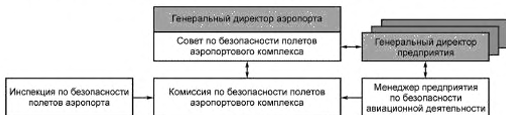
Рисунок 3 — Вариант организационной структуры СМБ аэропортового комплекса

На рисунке 3 приведен вариант организационной структуры СМБ АД аэропортового комплекса.