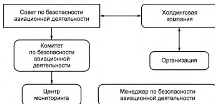
Рисунок 2 — Определение места организации в СМБ АД

Рисунок 2 дает представление об определении организации в общей системе СМБ АД для выявления ее масштабов и структуры.