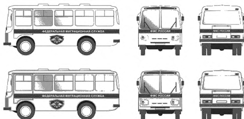
Рисунок А.2 – Цветографические схемы транспортных средств ФМС России