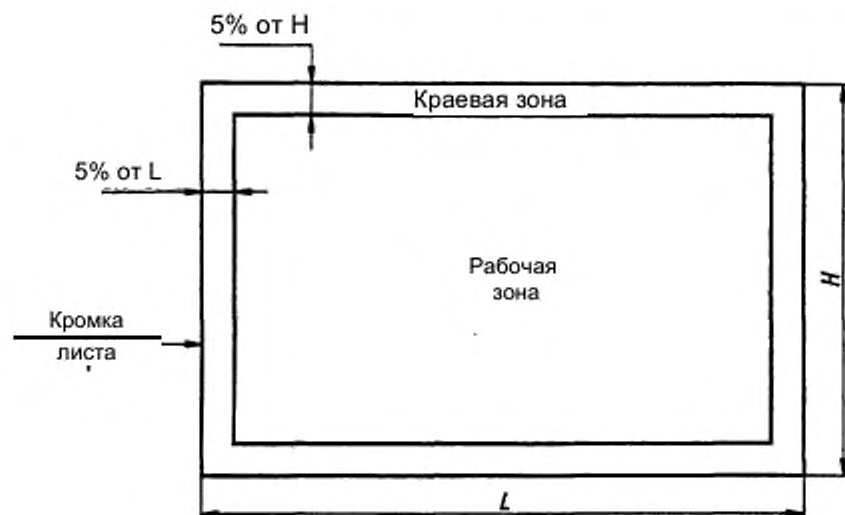
Рисунок 2 – Осматриваемые зоны стекла с покрытием конечного размера