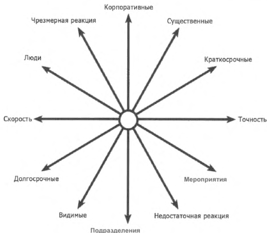
Рисунок 2 – Стратегические дилеммы в принятии решений

Например, могут быть важные дела, о которых знает менеджмент в условиях кризиса и которые должны быть выполнены (существенные, но менее заметные для СМИ или причастных сторон), но это может конфликтовать с необходимостью выполнить другие действия для демонстрации общего контроля, авторитета и укрепления доверия (что, возможно, менее важно, но более заметно). Точно так же курс действий с долгосрочной пользой может конфликтовать с курсом ожиданий общественности или сотрудников результатов в короткое время, что свидетельствовало бы о быстром решении.