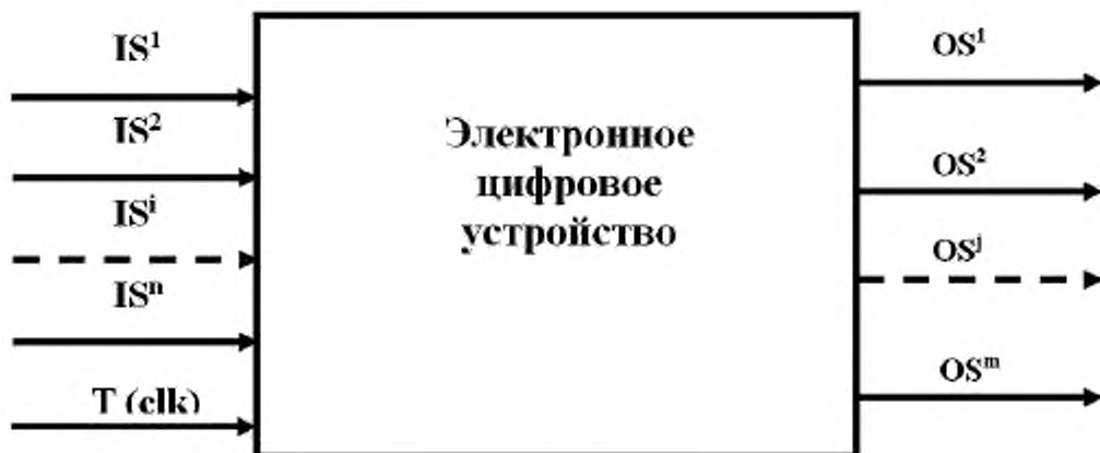
Рисунок 1 – Физическое представление устройства

6.1.4 Работа устройства тактируется одним из входных сигналов либо от одного внутреннего генератора, входящего в состав устройства. На входные контакты краевых разъемов могут подаваться входные цифровые тестовые воздействия, а с выходных контактов этих разъемов может быть снята реакция (выходные цифровые сигналы) устройства на входные воздействия. Сопоставление полученных реакций с эталонными позволяет сделать вывод о работоспособности ОК и осуществлять диагностику обнаруженных неисправностей. Совокупность входных воздействий и соответствующие им эталонные реакции ОК представляют собой тест.