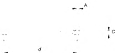
Рисунок 103 – Сосуд для испытания плиток

A – толщина основания и стенки ( 2 \pm 0,5 ) мм; C – максимальная вогнутость;