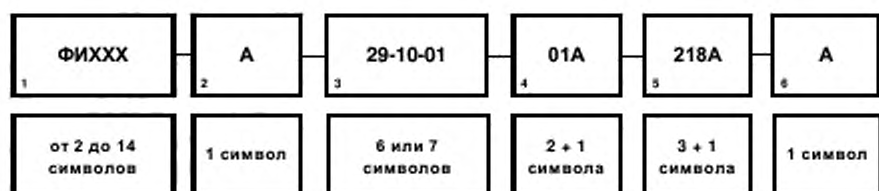
Рисунок А.1 – Структура ОМД

А.3.1 ОМД состоит из структурированного набора элементов, каждый из которых представляется одним или несколькими алфавитно-цифровыми символами (рис. 1).