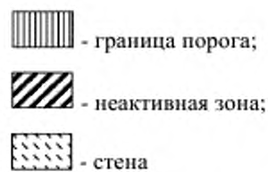
Рисунок 102 – Неактивные зоны на полу, чувствительные к давлению контактных зон