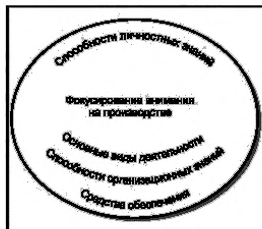
Рисунок 1 — Основа менеджмента знаний: европейская перспектива

2 Пять основных видов деятельности в отношении знаний были идентифицированы как наиболее широко применяемые: идентификация, создание, хранение, обмен знаниями и их применение. Они представляют собой второй компонент основы посредством формирования единого процесса.