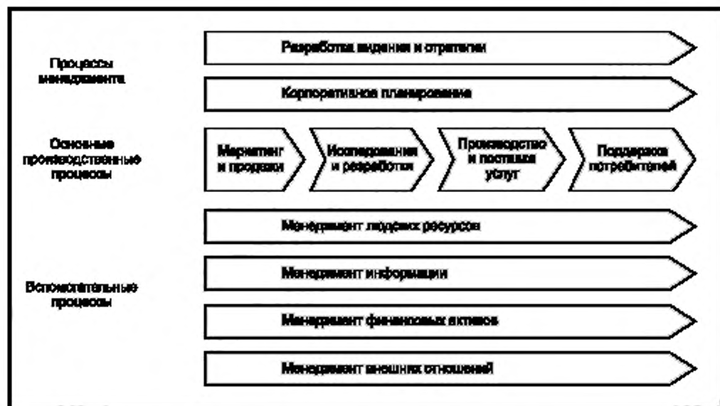
Рисунок 4 — Пример организационной карты процесса

Если организация нацелена на постоянную инновацию своего продукта, в этом случае инициатива по МЗ может улучшить менеджмент знания, необходимый для разработок, создать сетевые отношения с внешними исследовательскими подразделениями в университетах, и организации могут пригласить на работу брокера по знаниям для постоянного поиска самых последних инноваций и патентов в рамках производственной области.